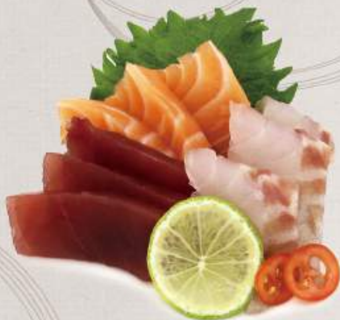
SASHIMI MORIAWASE Sashimi misto (9 fette)