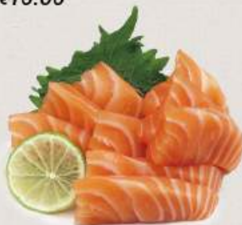
SAKE SASHIMI Salmon (9 fette)