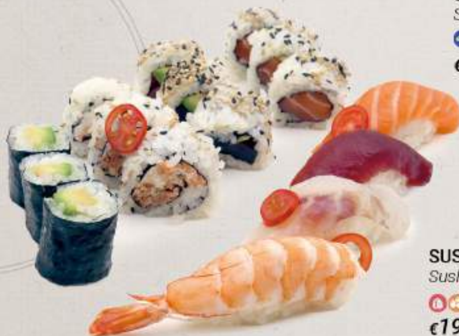
SUSHI MORIAWASE Sushi misto (16 pezzi)