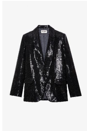
WWBL00812_NOIR VIVE SEQUINS XS S M L XL POLYESTER | POLYESTER 745€ 499€ / 735€ 492€