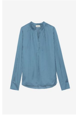
WWSH00021_BLUESTONE TINK SATIN XS S M L XL POLYESTER | POLYESTER 325€ 218€ / 320€ 214€