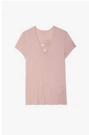
JWTS01580 Tea Rose STORY FISHNET SKULL FLOWERS XS S M L XL COTON | COTTON 105€ 70€ / 105€ 70€