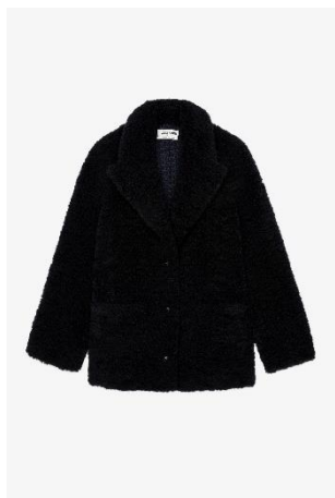
WWC000179_NOIR FLEUR SOFT CURLY XS S M L XL POLYESTER | POLYESTER 425€ 285€ / 405€ 271€