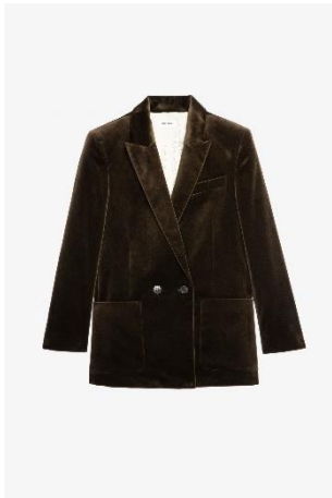
WWBL00001_KAKI VISKO VELVET XS S M L XL COTON | COTTON 575€ 385€ / 570€ 382€