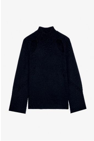
KWSW01551_ENCRE MICKY WE XS S M L XL MERINOS | MERINOS 455€ 305€ / 450€ 302€