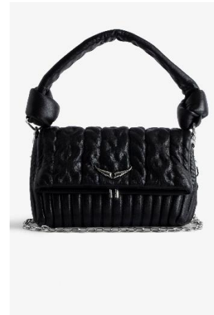
LWBA02424_NOIR ROCKY ETERNAL KNIT SHADOW CUIR | LEATHER 645€ 432€ / 625€ 419€