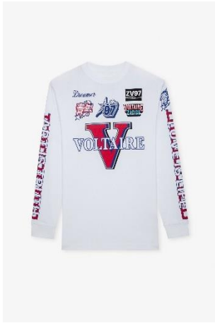
JWTS01558 Blanc NOANE VOLTAIRE MULTIBADGE XS S M L XL COTON | COTTON 225€ 151€ / 220€ 147€