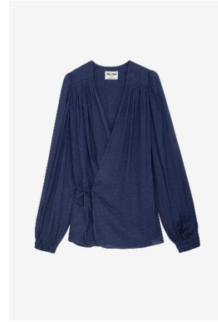
WWSH00520_MARINE TENEW SATIN ZV XS S M L XL POLYESTER | POLYESTER 395€ 265€ / 390€ 261€