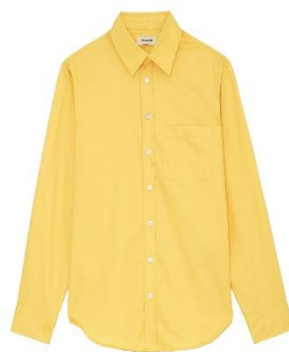
WWSH00518_SUN TASKIZ POP XS S M L XL COTON | COTTON 215€ 144€ / 210€ 141€