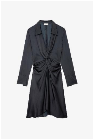
WWDR0023_NOIR ROZO SATIN XS S M L XL VISCOSE | VISCOSE 395€ 265€ / 370€ 248€