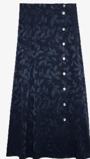
WWSK00351_ENCRE JUNE JAC IKAT XS S M L XL SOIE | SILK 475€ 318€ / 470€ 315€