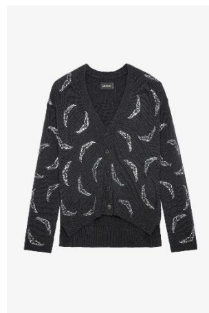
KWCA00549_ARDOISE MIRKA WS WINGS STRASS XS S M L XL CACHEMIRE | CASHMERE 645€ 432€ / 635€ 425€