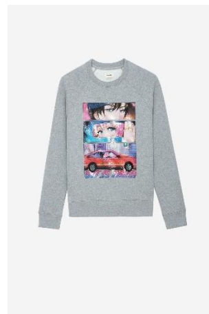
JWSS00532_GRIS CHINE UPPER MOON CAR XS S M L XL COTON | COTTON 275€ 184€ / 270€ 181€