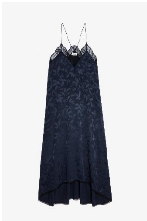
WWDR01272_ENCRE RISTY JAC IKAT XS S M L XL SOIE | SILK 545€ 365€ / 515€ 345€