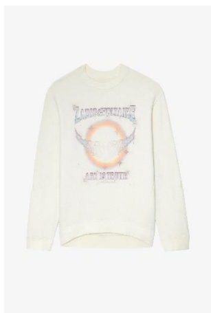
JWSS00551_SUGAR OTILIA COMPO CONCERT HORIZON XS S M L XL COTON | COTTON 325€ 218€ / 320€ 214€