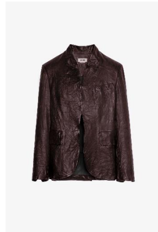
RWBL00019_CHOCOLATE VERYS CUIR FROISSE XS S M L XL CUIR | LEATHER 675€ 452€ / 665€ 446€