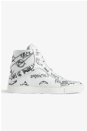
SWSN00444 Blanc HIGH FLASH SMOOTH CALFSKIN GRA 36 37 38 39 40 41 CUIR | LEATHER 395€ 265€ / 370€ 248€