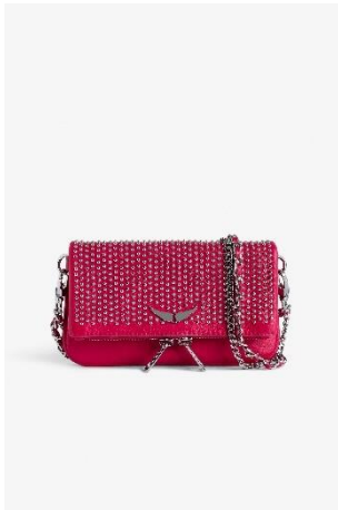
LWBA02381_PODIUM ROCK NANO PLUMETIS CUIR | LEATHER 345€ 231€ / 350€ 235€