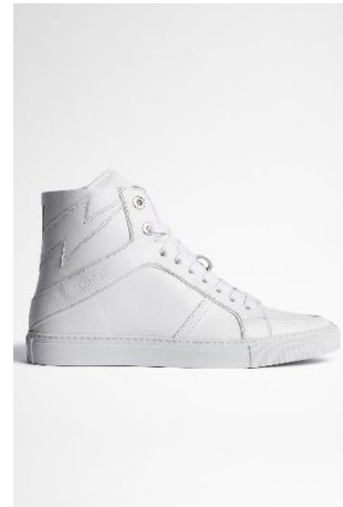
SWSN00008 Blanc ZV1747 HIGH FLASH SMOOTH CALFS 36 37 38 39 40 41 CUIR | LEATHER 295€ 198€ / 285€ 191€