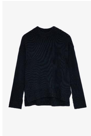
KWSW00018_VERT DE GRIS MALTA WS XS S M L XL CACHEMIRE | CASHMERE 695€ 466€ / 685€ 459€