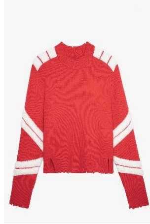
KWSW01581_JAPON GEORGIA WE XS S M L XL MERINOS | MERINOS 695€ 466€ / 685€ 459€