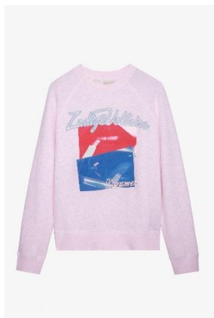
JWSS00541_POUFRE UPPER PHOTOPRINT DOUBLE PHOTOP XS S M L XL COTON | COTTON 215€ 144€ / 210€ 141€