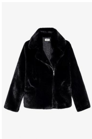
WWC000156_NOIR FREEZE COLOR XS S M L XL POLYESTER | POLYESTER 445€ 298€ / 440€ 295€