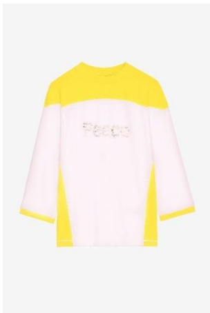
JWTS01551 Sun EARL PEACE XS S M L XL COTON | COTTON 175€ 117€ / 175€ 117€