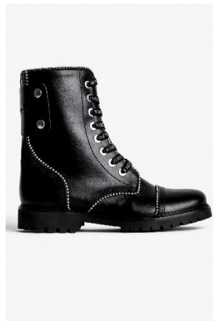
SWCT00005 NOIR JOE SMOOTH COWSKIN + STUDS PIP 36 37 38 39 40 41 CUIR | LEATHER 475€ 318€ / 460€ 308€