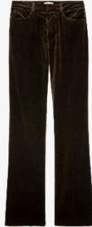
WWPA00697_KAKI PISTOL VELVET XS S M L XL COTON | COTTON 345€ 231€ / 340€ 228€