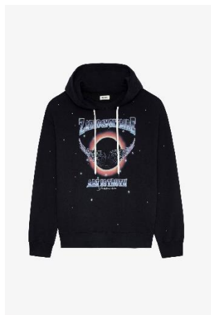
JWSS00544_NOIR ELISIO COMPO CONCERT HORIZON XS S M L XL COTON | COTTON 395€ 265€ / 390€ 261€