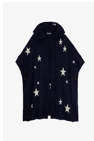
KWC000064_ENCRE INNA WS STARS XS/S M/L CACHEMIRE | CASHMERE 845€ 566€ / 835€ 559€