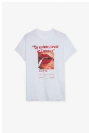
JWTS01564 Blanc TOM QUINTESSENCE BOUCHE COMPO XS S M L XL COTON | COTTON 115€ 77€ / 115€ 77€