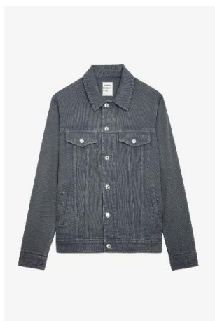
WWOW00614_ARDOISE KASE COTON TWILL XS S M L XL COTON | COTTON 345€ 231€ / 340€ 228€