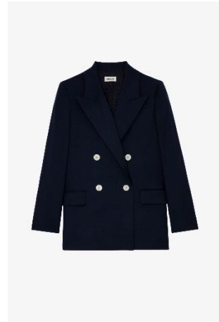
WWBL00810_ENCRE VIEW TAILLEUR XS S M L XL POLYESTER | POLYESTER 575€ 385€ / 570€ 382€