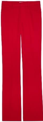
WWPAA00010_JAPON PISTOL CREPE XS S M L XL POLYESTER | POLYESTER 325€ 218€ / 320€ 214€