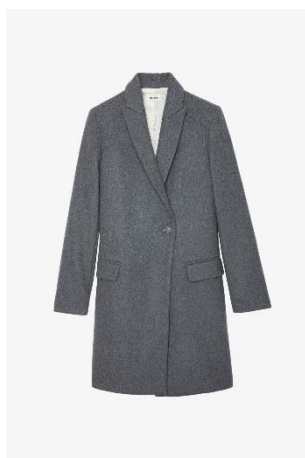
WWC000207_GRIS CHINE MARCO CHINE XS S M L XL LAINE | WOOL 595€ 399€ / 590€ 395€