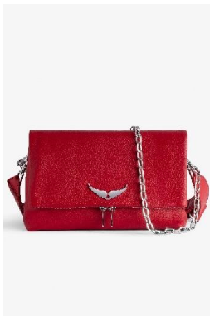
LWBA00008_POWER ROCKY GRAINED LEATHER CUIR | LEATHER 445€ 298€ / 420€ 281€