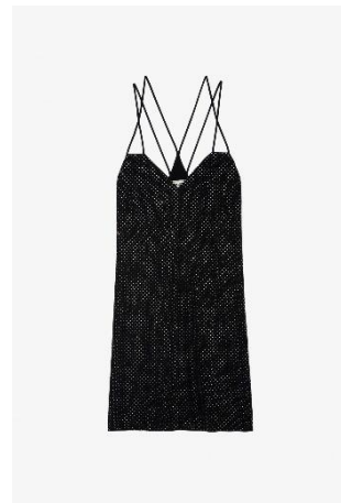
WWDR01260_NOIR ROHANA CDC STRASS XS S M L XL SOIE | SILK 845€ 566€ / 750€ 503€