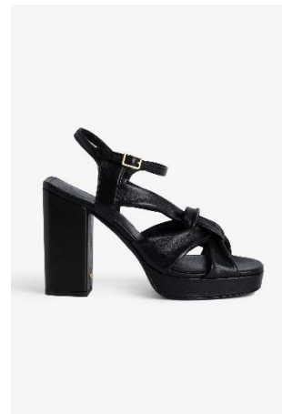
SWCT00821 NOIR FORGET ME KNOT SMOOTH LAMBSKIN 36 37 38 39 40 41 CUIR | LEATHER 495€ 332€ / 470€ 315€