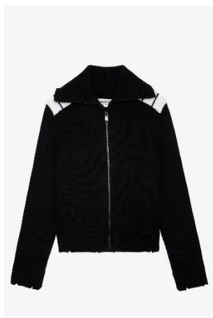
KWCA00553_NOIR JESSIE WE XS S M L XL MERINOS | MERINOS 795€ 533€ / 785€ 526€