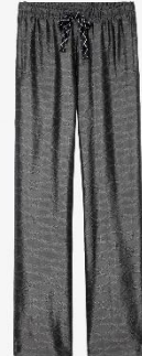
WWPA00776_ANTHRACITE POMY JAC WINGS XS S M L XL ACETATE | ACETATE 325€ 218€ / 320€ 214€