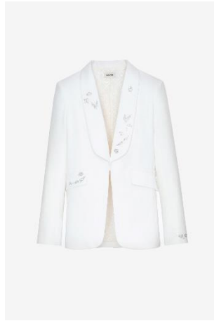
WWBL00809_JUDO DATE STRASS WINGS XS S M L XL POLYESTER | POLYESTER 565€ 379€ / 560€ 375€