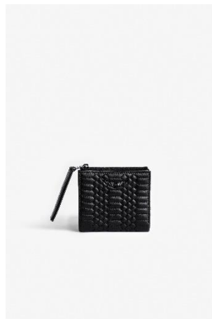
LWSG00048_NOIR ZV FOLD MAT SCALE VISCOSE | VISCOSE 175€ 117€ / 170€ 114€