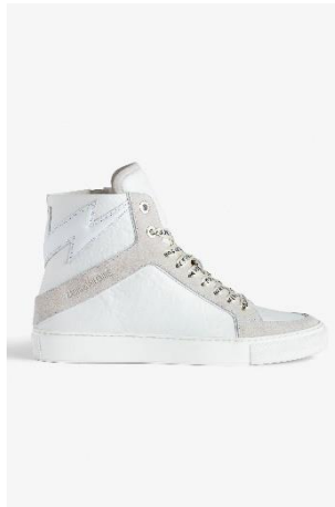
SWSN00431 Blanc HIGH FLASH WRINKLE 36 37 38 39 40 41 CUIR | LEATHER 445€ 298€ / 440€ 295€