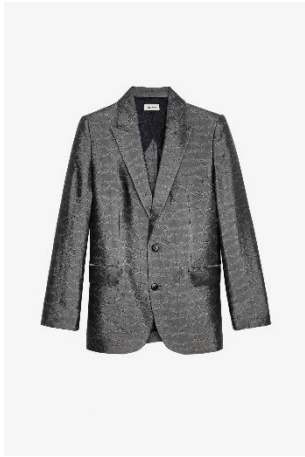
WWBL00826_ANTHRACITE VEGY JAC WINGS XS S M L XL ACETATE | ACETATE 625€ 419€ / 615€ 412€