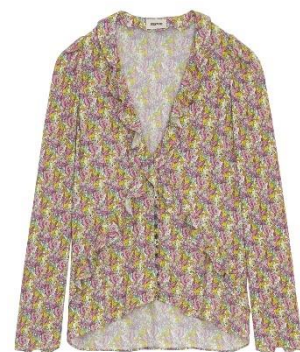
WWSH00522_SUN TRESSE CREPE LIBERTY WINGS XS S M L XL VISCOSE | VISCOSE 295€ 198€ / 290€ 194€