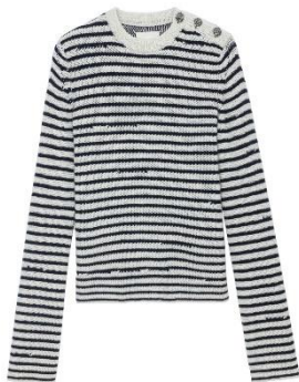
KWSW01542_SUGAR JADE WE XS S M L XL CACHEMIRE | CASHMERE 535€ 358€ / 530€ 355€