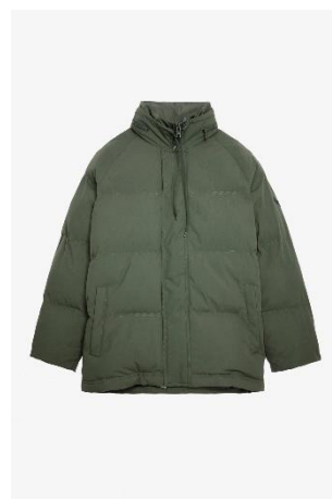
WWOW00570_KAKI BRISTOLA XS S M L XL POLYESTER | POLYESTER 595€ 399€ / 590€ 395€