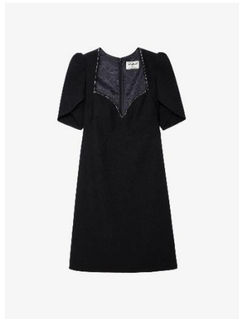
WWDR01289_NOIR ROXELLE CREPE STRASS XS S M L XL VISCOSE | VISCOSE 345€ 231€ / 325€ 218€