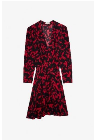
WWDR01300_NOIR ROGERS SOFT IKAT XS S M L XL SOIE | SILK 475€ 318€ / 445€ 298€