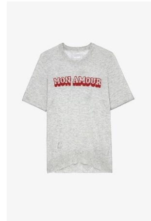
KWSW01544_NEIGE IDA CP MON AMOUR XS S M L XL CACHEMIRE | CASHMERE 365€ 245€ / 360€ 241€