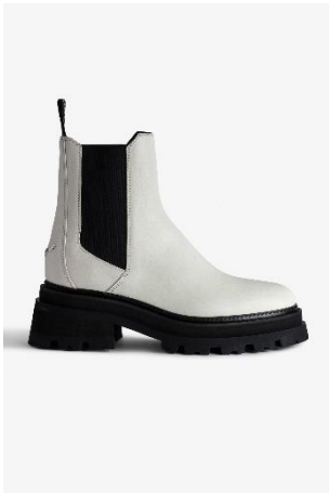
SWCT00804 ICE RIDE CHELSEA SEMY-SHINY CALFSK 36 37 38 39 40 41 CUIR | LEATHER 495€ 332€ / 470€ 315€