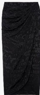
WWSK00363_NOIR JAMELIA JAC MANIFESTO XS S M L XL SOIE | SILK 595€ 399€ / 590€ 395€