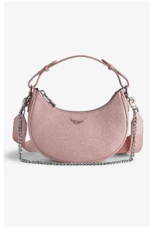
LWBA02401_COSY MOONROCK GRAINED LEATHER CUIR | LEATHER 495€ 332€ / 490€ 328€