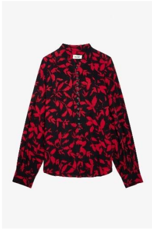
WWSH00543_NOIR TWINA SOFT IKAT XS S M L XL VISCOSE | VISCOSE 275€ 184€ / 270€ 181€