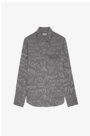
WWSH00529_GRIS MOYEN MORNING JAC MANIFESTO XS S M L XL SOIE | SILK 495€ 332€ / 490€ 328€