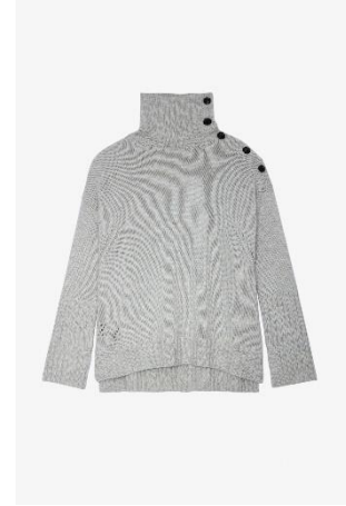
KWSW00007_NATUREL ALMA WS XS S M L XL CACHEMIRE | CASHMERE 745€ 499€ / 735€ 492€