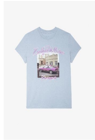
JWTS01570 Horizon ZOE PHOTOPRINT COMPO PINK CAR XS S M L XL COTON | COTTON 95€ 64€ / 95€ 64€