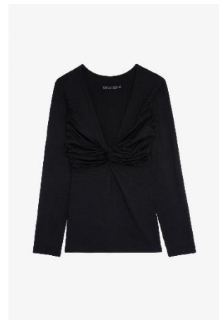
JWTS01585 Noir OTIS XS S M L XL VISCOSE | VISCOSE 265€ 178€ / 260€ 174€